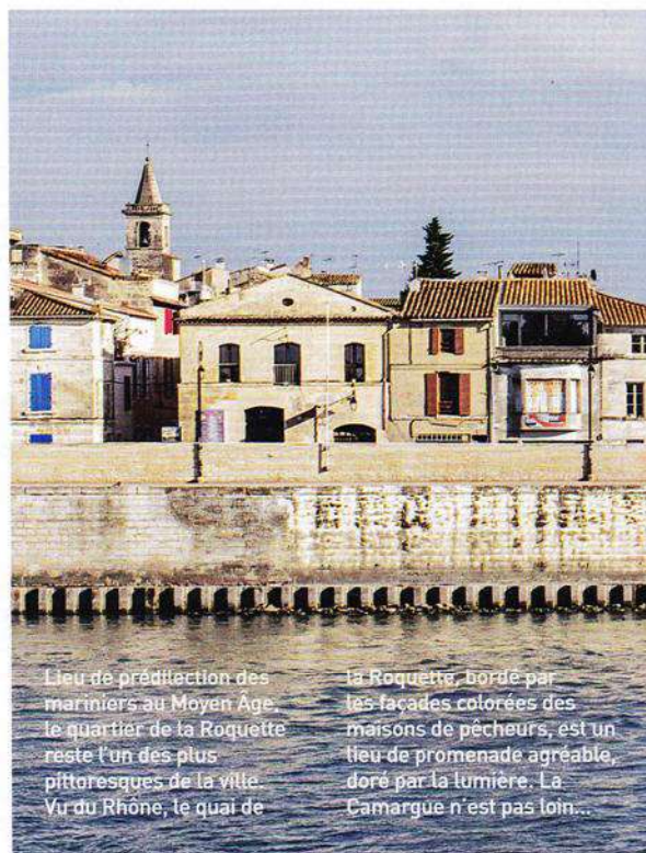
Lieu de prédilection des mariniers au Moyen Âge, le quartier de la Roquette reste l'un des plus pittoresques de la ville. Vu du Rhône, le quai de